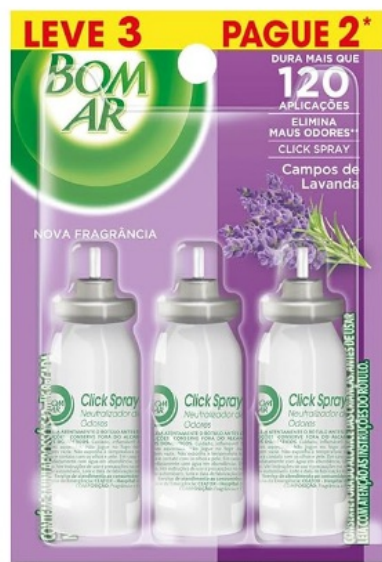
Passa o mouse para ampliar a imagem